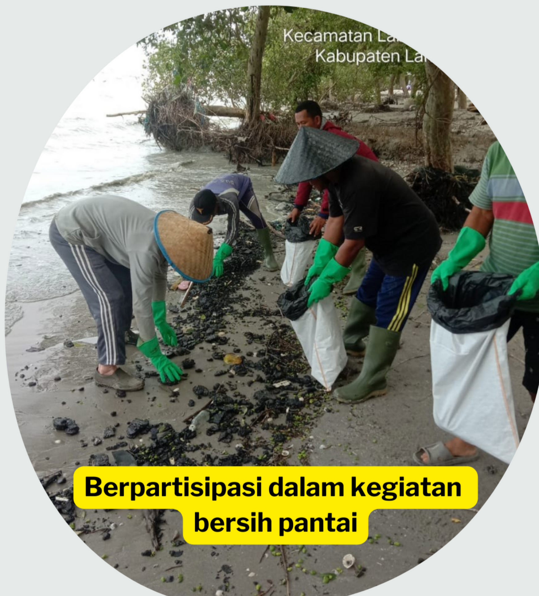
Berpartisipasi dalam kegiatan bersih pantai