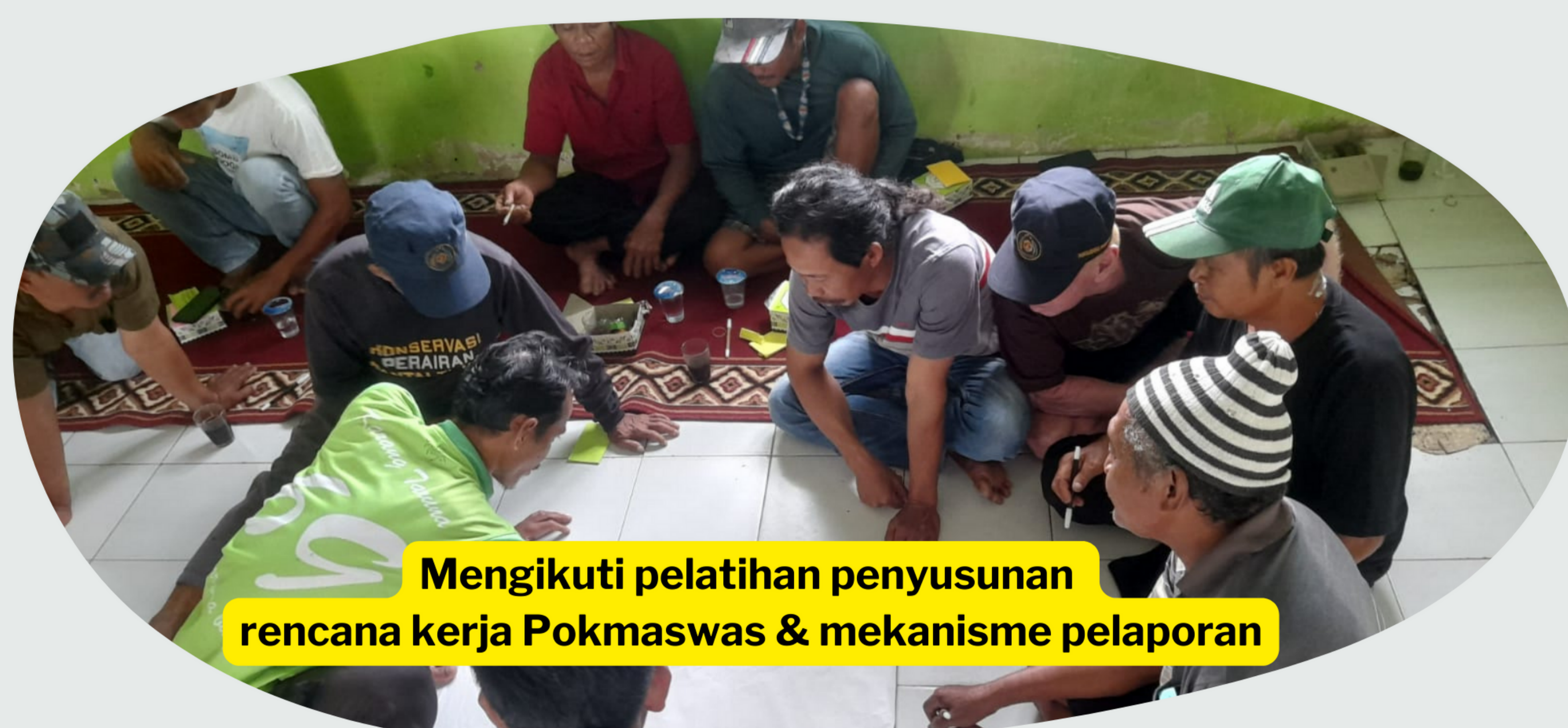
Mengikuti pelatihan penyusunan rencana kerja Pokmaswas & mekanisme pelaporan