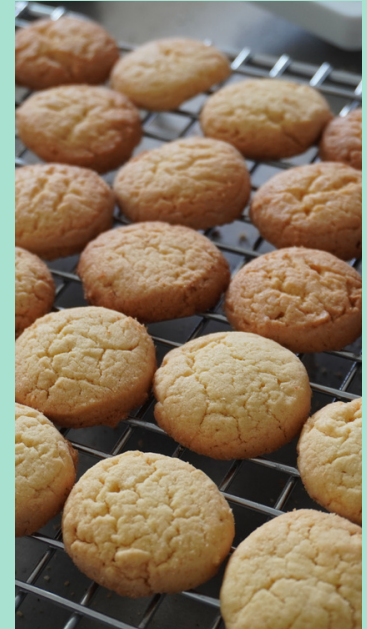
Biskuit dan kue kering berbahan baku tepung rajungan