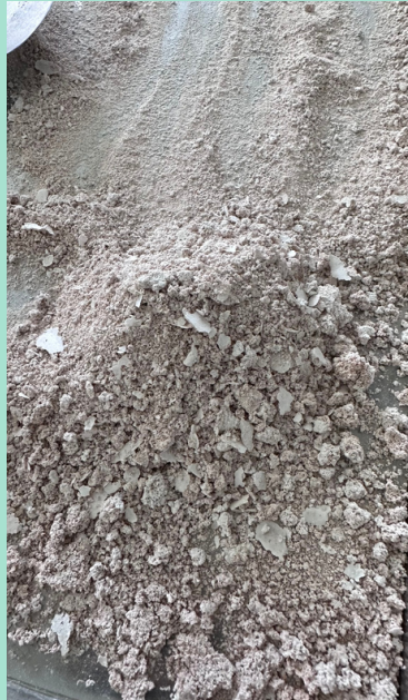
Tepung berbahan baku cangkang rajungan