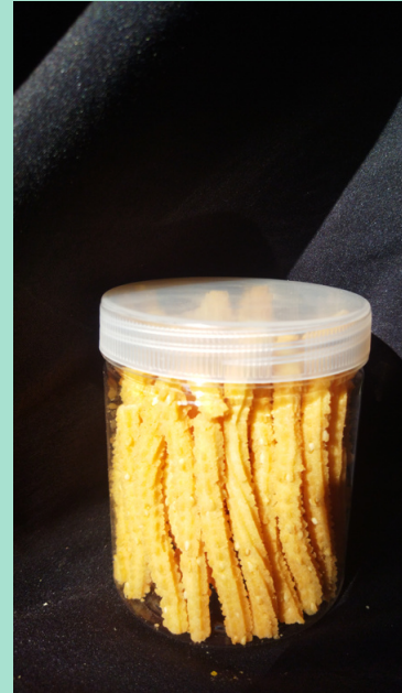
Stik berbahan baku lemak rajungan